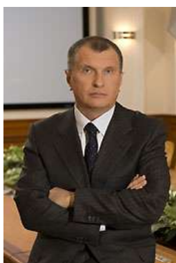
Сечин Игорь Иванович